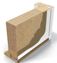
Innerdør EI30/ dB35