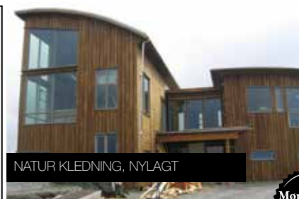
NATUR KLEDNING, NYLAGT

Treverket kan normalt stå mellom 10 og 20 år før første vedlikeholdende behandling, dersom man ikke vektlegger det kosmetiske.