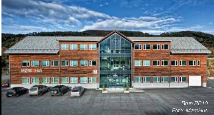
Brun RB10