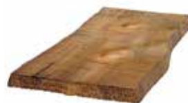
Uten endepløying. Varierende bredde. Håndskavet. Underligger: dim 19x173