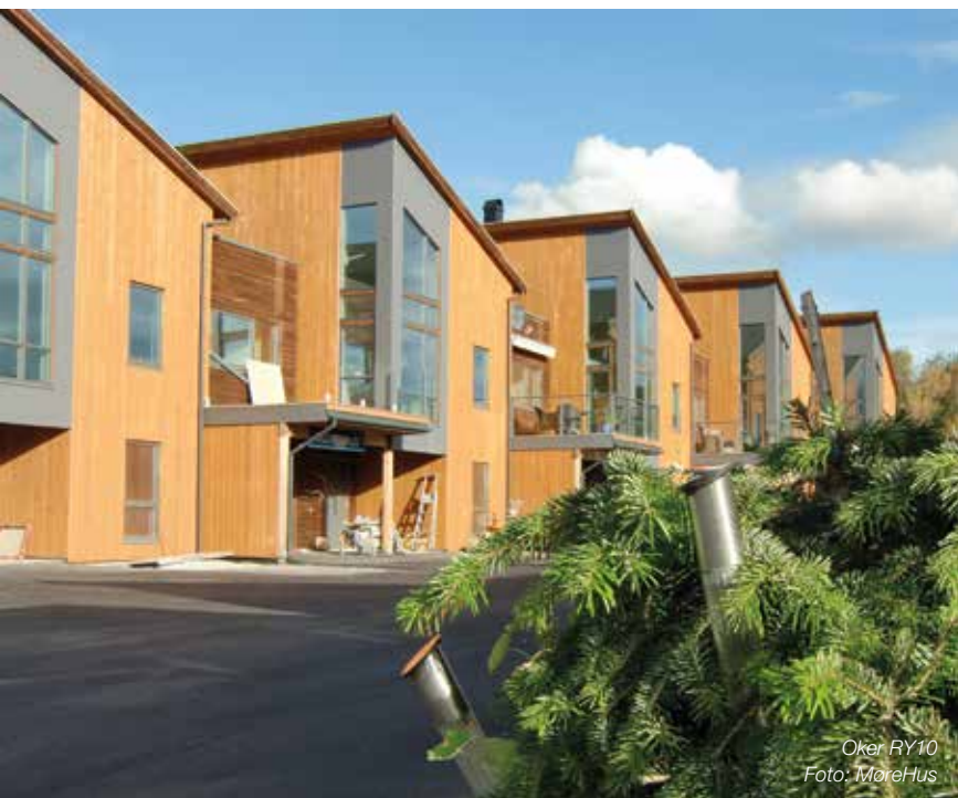
Oker RY10