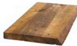
Uten endepløying. Varierende bredde, en rett kant. Håndskavet.

Villmarkskledning er fortsatt et populært kledningsvalg i noen byggestiler, og vi leverer både i liggende og stående utgave.