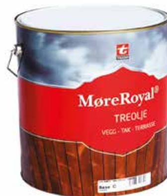
MøreRoyal® Treolje FOR VEGG OG TAK

PRODUKTER SÆRLIG TILPASSET MøreRoyal®- BEHANDLET TREVERK.