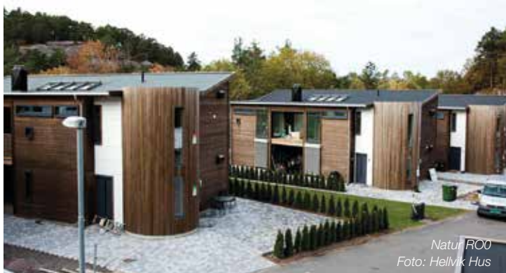
Natur RO0