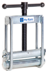
SOU63HF (20 - 63mm dia.)