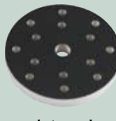
ekstra myk 2 608 601 126