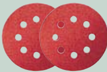
Klargjøring / finsliping K 80 til K 240