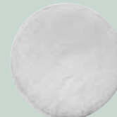
Lammeullhette 2 609 256 049