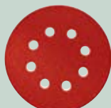
Vekksliping K 40/60