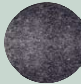
Poleringsfilt 2 609 256 054