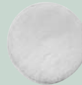
Lammeullhette 2 609 256 049