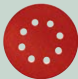
Vekksliping K 40/60