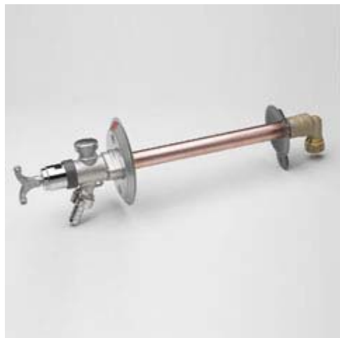
Frostfri slangekran, DN15