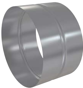
Skjøtemuffe i galvanisert stål. Skarvmuff av galvaniserat stål. Fixing sleeve in galvanised steel.

ART.NR.: 12081, 12082, 12083, 12084, 116959, 02281, 02282, 100712, 02283