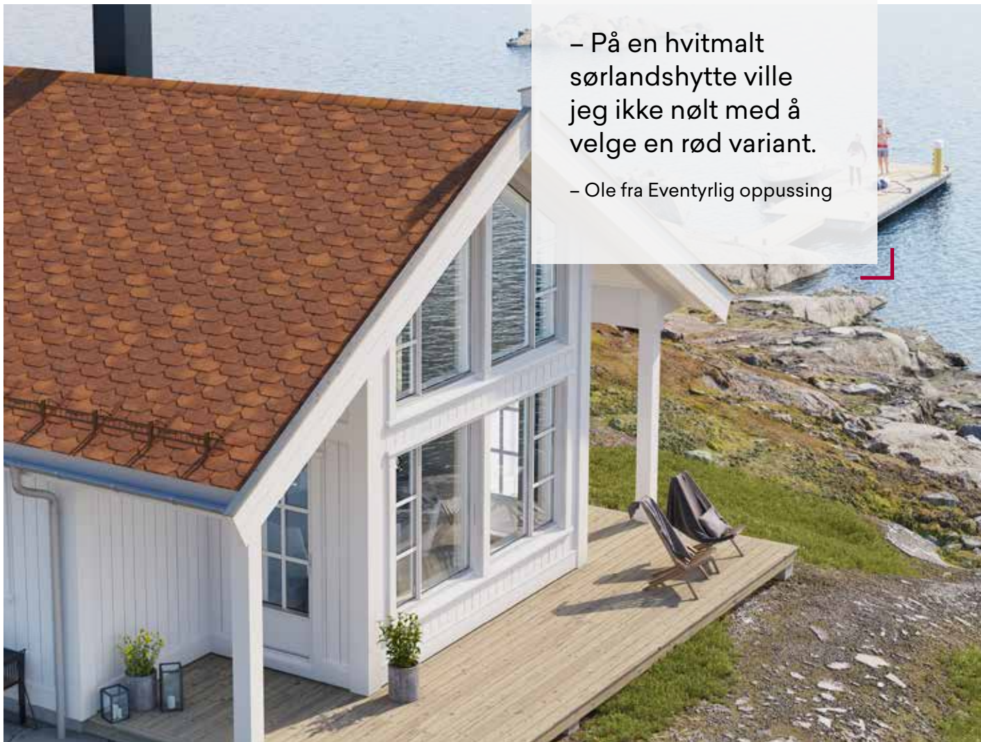
Isola Takshingel Kuttet, Rustikk-Rød

– På en hvitmalt sørlandshytte ville jeg ikke nølt med å velge en rød variant.