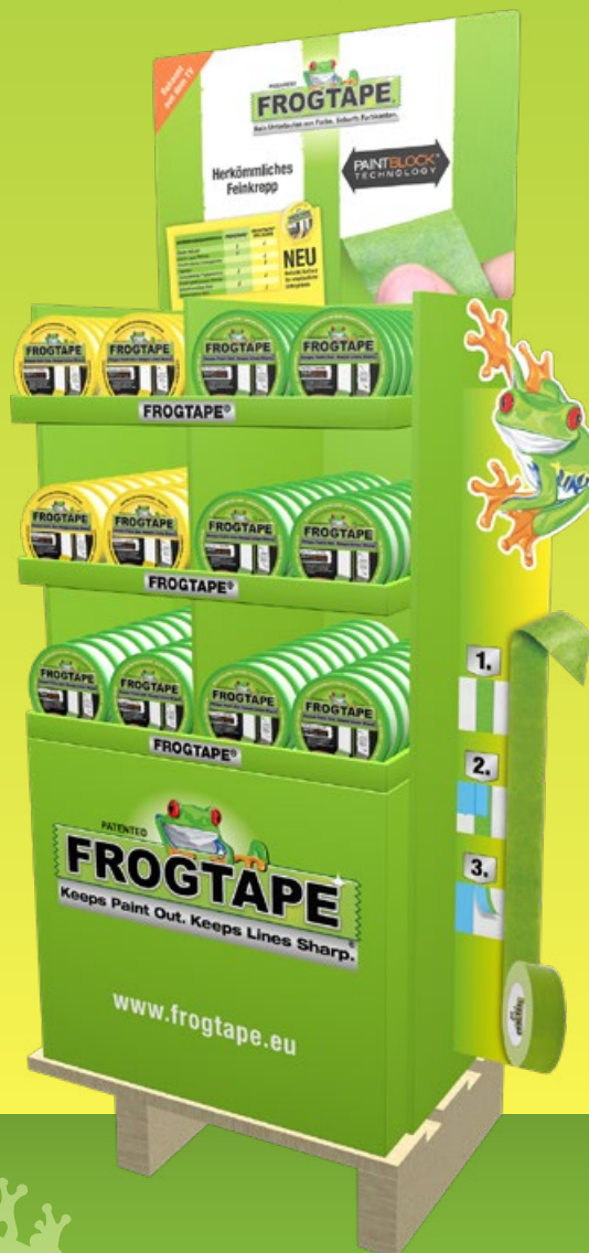
Pallet Display Large