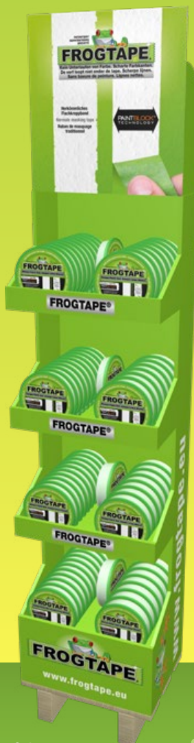
Pallet Display small