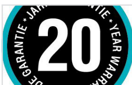
HØY KVALITET FOR LANG VARIGHET