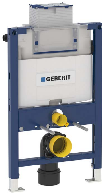
Fig. 2 Geberit Duofix Omega Figur: Geberit AS