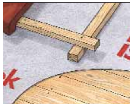
Pro Super som underlagsbelegg på bærende taktro av rupanel

Pro Super er dermed en effektiv og funksjonell løsning også ved rehabilitering av gamle takkonstruksjoner.