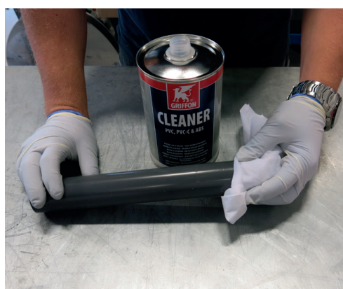
Rengjør rør og rørdel.