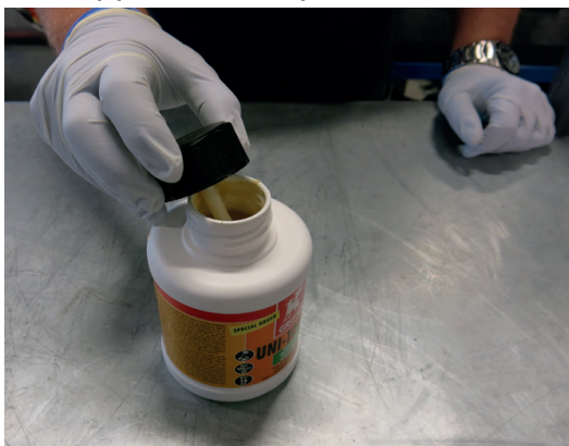
Rør godt om i limet før bruk.