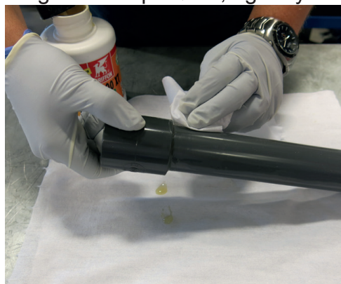
Tørk av overflødig lim.