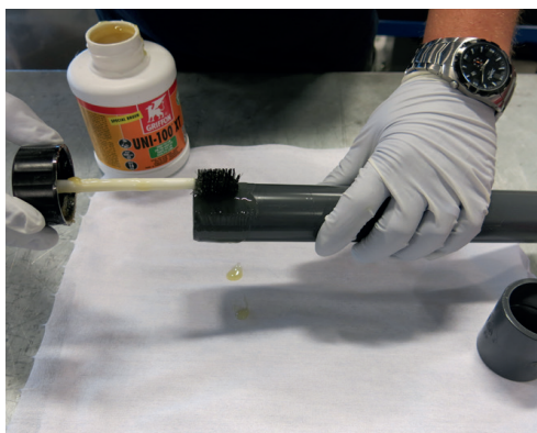
Lim på med pensel i lengderetning. Legg et tykt lag med lim på røret, og et tynt et i muffen.