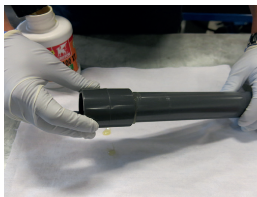
Press delene sammen, unngå å vri delene!