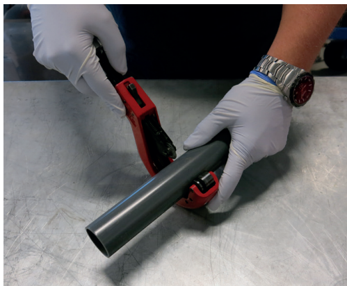
Kapp røret vinkelrett.