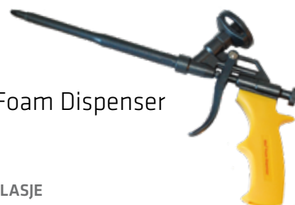
SikaFoam Dispenser C295