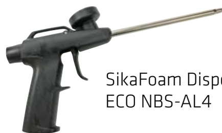
SikaFoam Dispenser ECO NBS-AL4