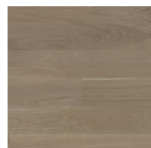
Eik Harmoni Skandinavia