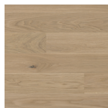
Eik Harmoni Norden