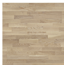
Eik Harmoni Klassisk Hvit