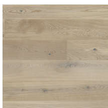
Eik Harmoni Nordlys