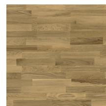
Eik Harmoni Klassisk Natur