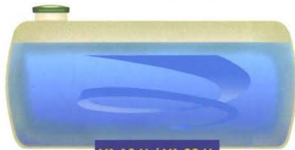
VA 10 LI / VA 20 LI