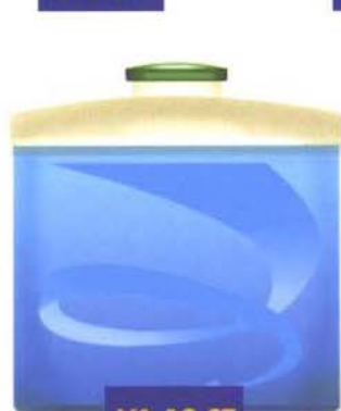
VA 10 ST