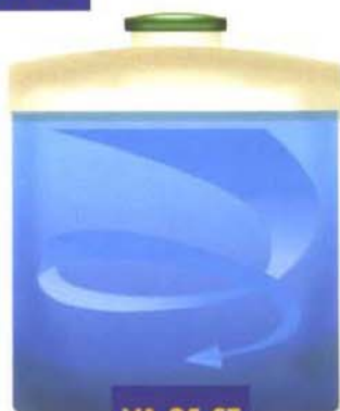
VA 25 ST