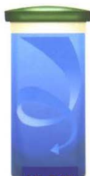
VA 3 ST

BIA MILJØ AS 5315 Herdla Tlf 56 15 11 00 Fax 56 15 11 15 internett: www.bia.no e-mail: firmapost@bia.no