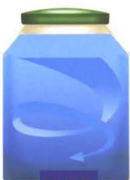
VA 5 ST