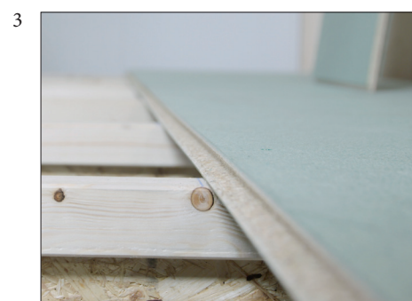
3 Vær nøye sånn at første platerad blir helt rett. Benytt krittsnor.