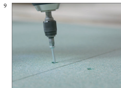
9 Det skal brukes min. 3 skruer på tvers av platene ved hver understøttelse.