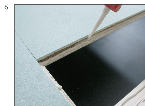
6 Platens profiler skal full-limes