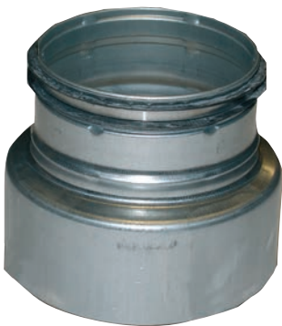
Reduksjon med muffe/nippel. Reduktion med muffe/nippel. Reduktio muhvilla/nipalla. Reduction with coupling/nipple.

ART.NR.: 12378, 12391, 12392, 116536, 12374, 12373, 12372, 117177