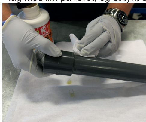
Tørk av overflødig lim.