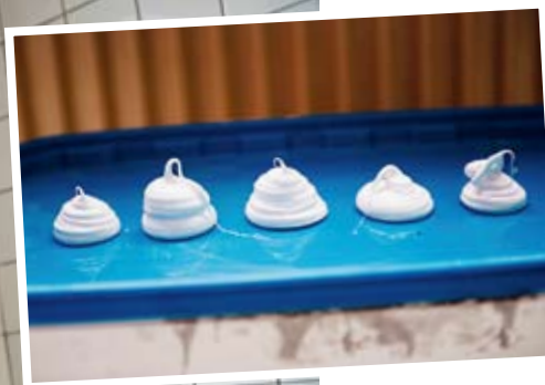
Smarriga maränger? Tyvärr inte, utan ett resultat av att plattsättarna provade hur mycket silikon ett tryck gav.