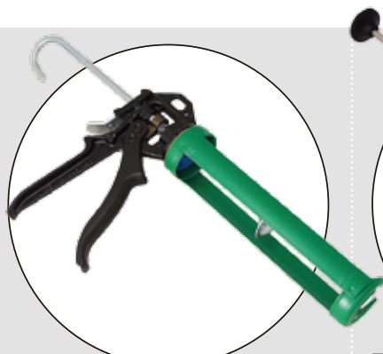
TEC 7 GUM

Betygen på respektive testfaktor är ett medelvärde av testpiloternas betyg. Slutbetyget är en helhetsbedömning som sätts av redaktionen. Där vägs kommentarer och pris in.