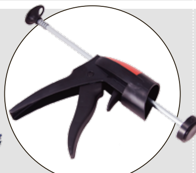
CASCO QUICK GUN