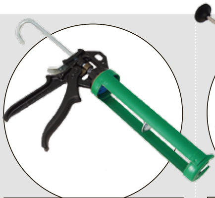
TEC 7 GUM

Betygen på respektive testfaktor är ett medelvärde av testpiloternas betyg. Slutbetyget är en helhetsbedömning som sätts av redaktionen. Där vägs kommentarer och pris in.