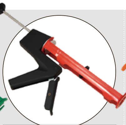
SIKA H 14