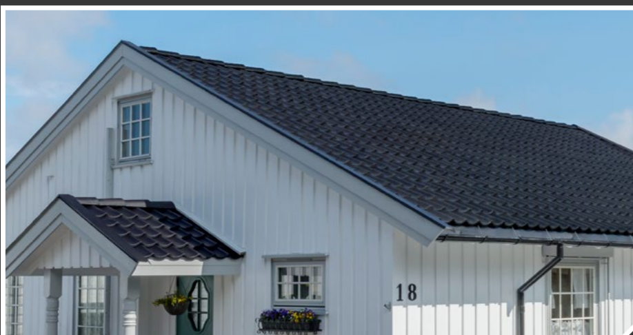
Hele huset har fått en ansiktsløftning og taket har fått 10 nye år.