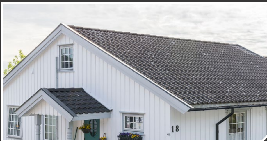
Ubehandlet, 30 år gammelt tak.