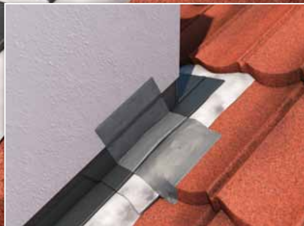
Seal-a-Leak brukt for tetting av lekkasje i pipebeslag