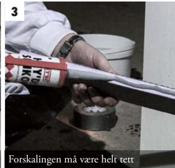
3 Forskalingen må være helt tett