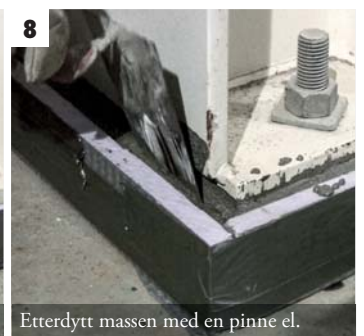
8 Etterdytt massen med en pinne el.