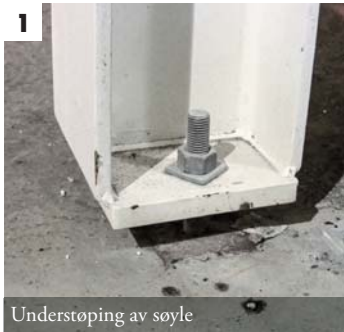
1 Understøping av søyle