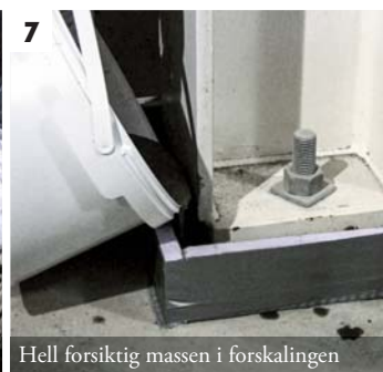
7 Hell forsiktig massen i forskalingen