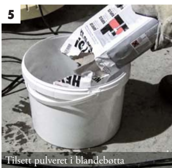
5 Tilstett pulveret i blandebøtta