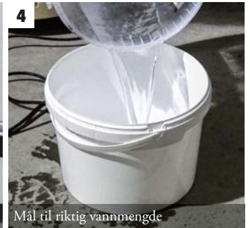
4 Mål til riktig vannmengde