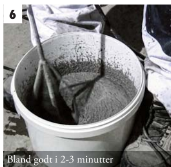
6 Bland godt i 2-3 minutter