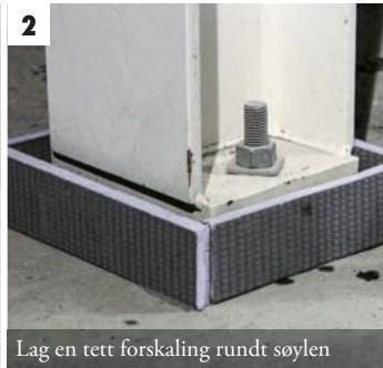
2 Lag en tett forskaling rundt søylen