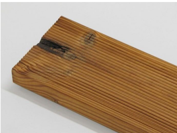
Defekter inntil 8 cm fra endene på bordet er tillatt.