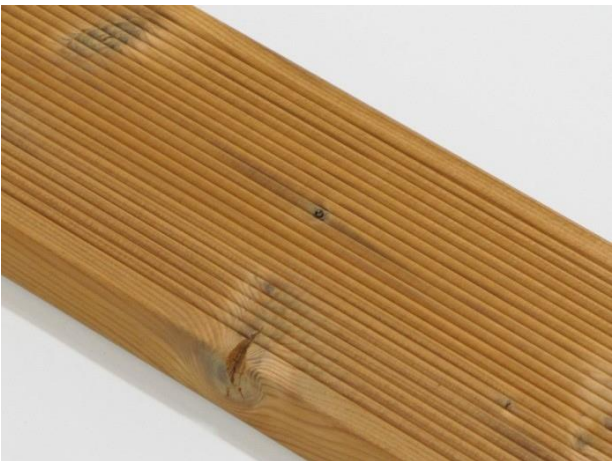
Små sprekker i kvist på endene av bordene er tillatt.