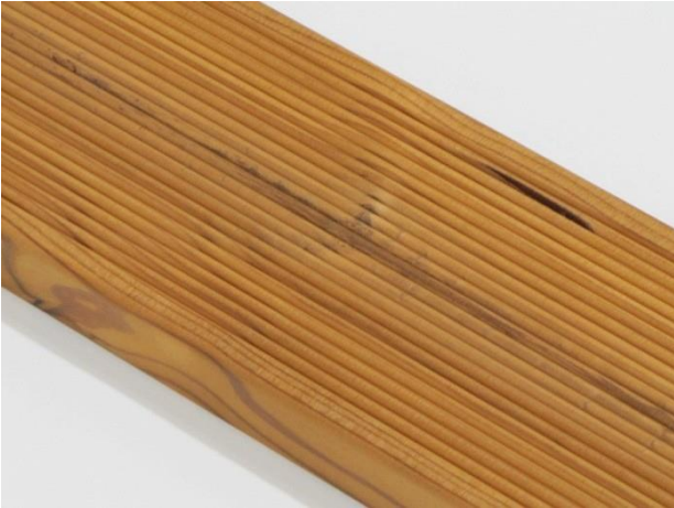
Kvaelommer er tillatt.