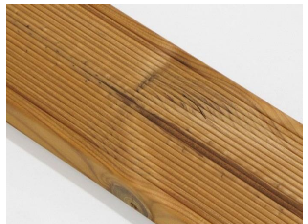
Mindre innslag av marg på overflaten er tillatt..