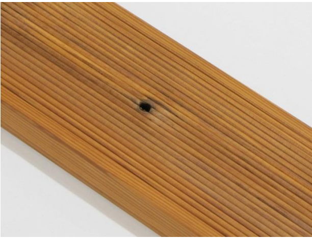
Små kvisthull (ikke gjennomgående) på et bord er tillatt.