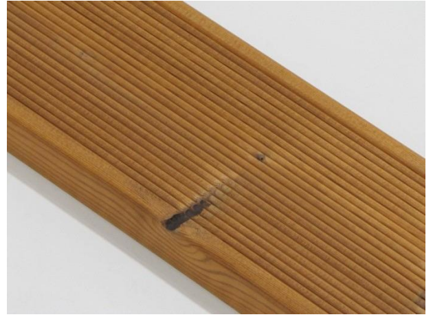
Små kvist utfall er tillatt.