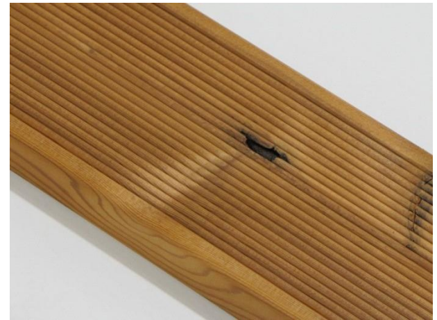
Små defekter på overflaten kan forekomme.