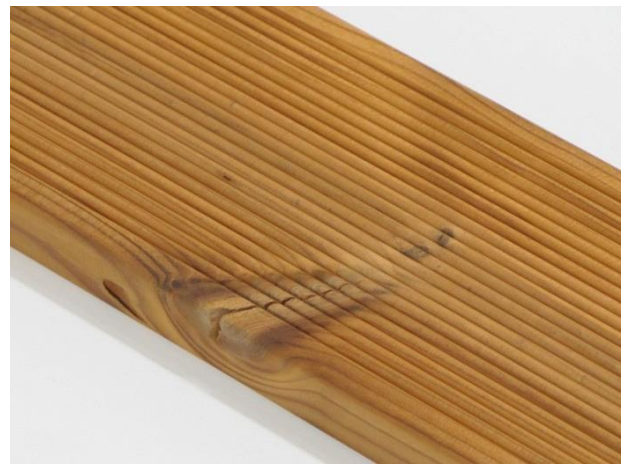
Små sprekker i kvist er tillatt.