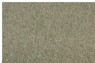
Astra 174 Grå