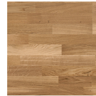
Pure Oak TreS PN