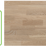
Shade Oak Cream TreS PN