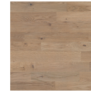
Shade Oak Beige TreS PN