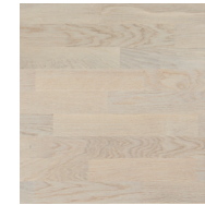
Shade Oak Cotton TreS PN