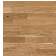
Pure Oak TreS PL