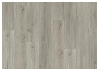
Laponia - Click 6 mm Impression