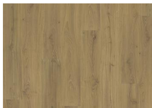
Foxall - Click 6 mm Impression