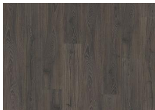
Odenwald - Click 6 mm Impression