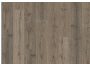
Spreewald - Click 6 mm Impression