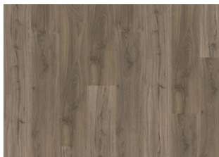
Kelham - Click 6 mm Impression