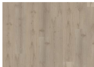
Dovecot - Click 6 mm Impression