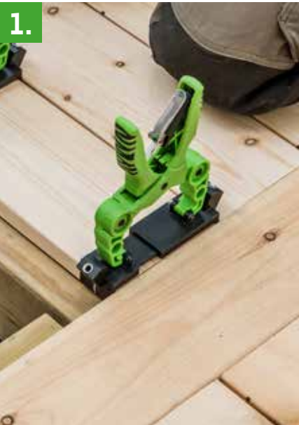
1. Klem fast monteringsverktøyet.