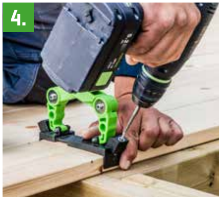
4. Monter med HDS-bits – begynn alltid med den ytterste skruen.