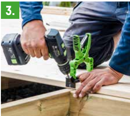
3. Vinkle drillen slik at batteriet ikke slår mot bjelkelaget. På den måten er det mindre risiko for feilmontering samt skader på monteringsverktøy og bits.