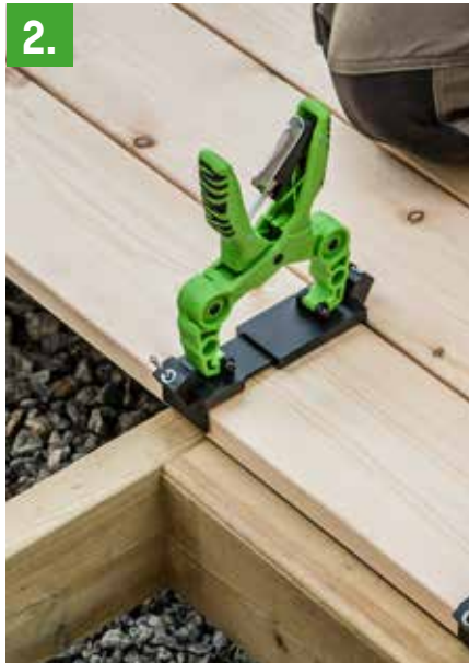
2. Plasser en skrue i hvert monteringshull.