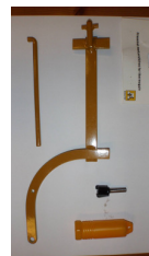
Fresemal m/ profilfres