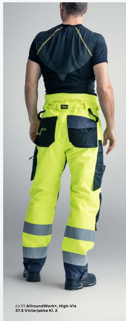
6639 AllroundWork+, High-Vis 37.5 Vinterbukse Kl. 2

Størrelser: XS kort – XL kort; XS – XXL; XS lang – XL lang