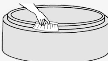
1) Rengjør falsen.

Fugebånd skal lagres liggende og helst i romtemperatur. Da vil man stadig ha et mykt og monteringsvillig bånd.