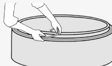
2) Legg på fugebåndet med 5-10 cm overlapp.