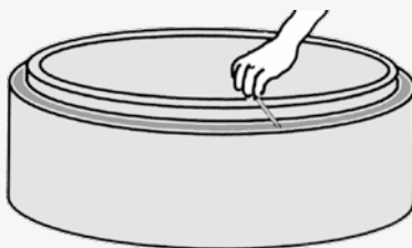
3) Fjern beskyttelsespapiret.