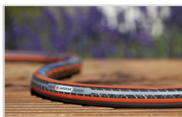
TETT, H YKVALITETS SPIRALMESH-TEKSTIL