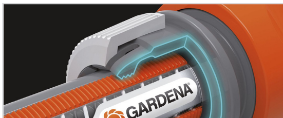
MED POWER GRIP-PROFIL