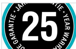
H Y KVALITET FOR LANG VARIGHET