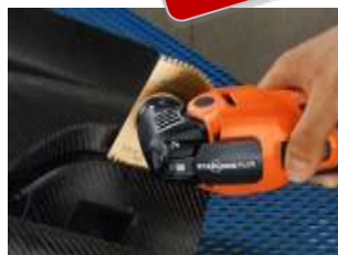
GFRP / CFRP sagblad