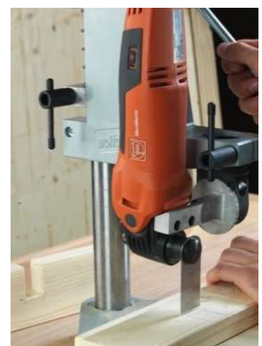
Holdeinnretning for bord