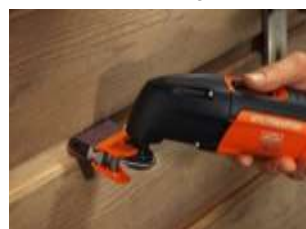
Profil pusse sett