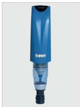
Infinity A + AP

Infinity AP: Automatisk tids- og differensetrykkstyrt tilbakespylingsfilter (autosil)