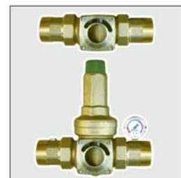
Tilkoblingsmoduler 1 1/2" – 2"

Aktuell versjon fra september 2005. Erstatter alle tidligere versjoner