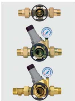
Tilkoblingsmoduler 3/4" – 1 1/4"

Tilkoblingsmodul 3/4" – 1 1/4" m/reduksjonsventil