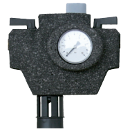
AQA therm HFB-1717 BA