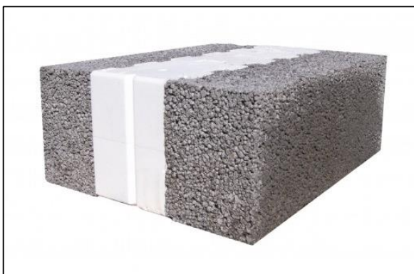
Letklinkerblok, hvid kerne