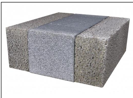
Letklinkerblok, grå kerne (med grafit)