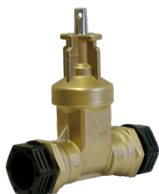
S-2150 med PRK