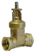
S-2151 med gjenger