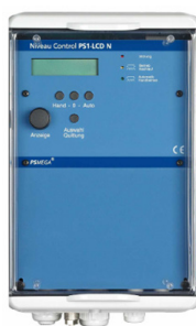
Intec Control PS1-LCD