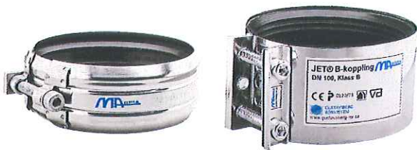
Fig. 3 KJ-MA Avløpssystem – Koblinger