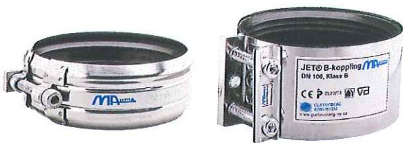
Fig. 3 KJ-MA Avløpssystem – Koblinger