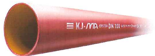
Fig. 1 KJ-MA Avløpssystem – MA-rør

Godkjenningen gjelder for bortledning av avløpsvann (gråvann) inne i bygninger. Systemet kan også benyttes til bortledning av innvendig overvann, men slike installasjoner er ikke omfattet av denne godkjenningen.