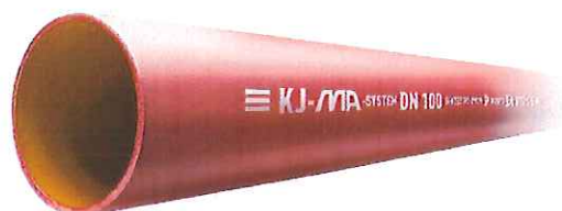
Fig. 1 KJ-MA Avløpssystem – MA-rør

Godkjenningen gjelder for bortledning av avløpsvann (gråvann) inne i bygninger. Systemet kan også benyttes til bortledning av innvendig overvann, men slike installasjoner er ikke omfattet av denne godkjenningen.