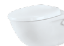
CHARM BY JETS® Veggmodell, porselen