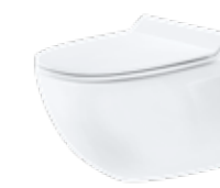
JADE BY JETS® Veggmodell, porselen Softsound™