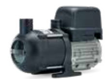
Jets® C200 Ultima 230V