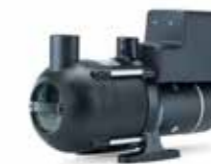
Jets® C200 Ultima 12V