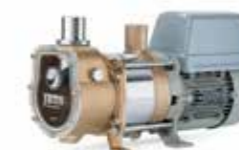
Jets® Edge S 230V