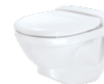
JETS® 59M Veggmodell, porselen