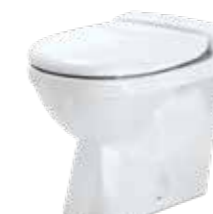
JETS® 50M Gulvmodell, porselen