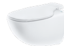
PEARL BY JETS® Veggmodell, porselen

Vi jobber hele tiden med å videreutvikle våre produkter, og vår nyeste toalettmodell, Jade by Jets®, er det mest lydsvake vakuumpoiletet på markedet.