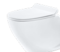
JADE BY JETS® Gulvmodell, porselen Softsound™