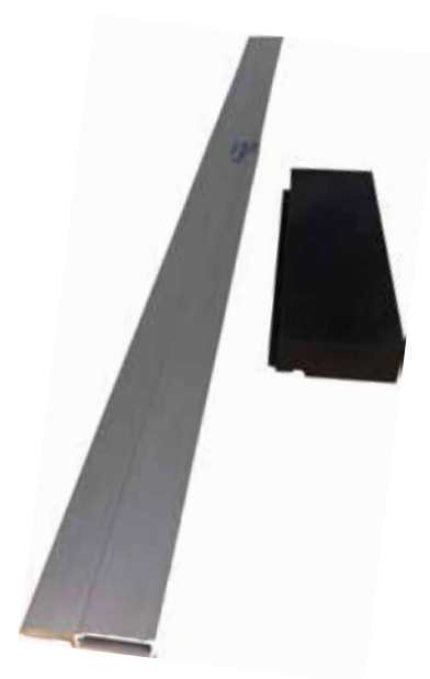
Nobbnr. 57171164 Monteringsverktøy

* Dette er viktig. Skjøtene skal ikke sparkles, men pusses lett med et 240 sandpapir etter første malingsstrøk. Deretter males 1-2 strøk til. Pusser du for hardt eller med for grovt papir tar du bort strukturen i grunningspapeten.