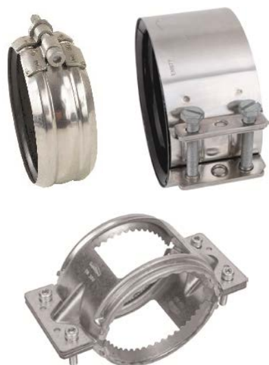
Fig. 3 PAM MA avløpssystem – Koblinger