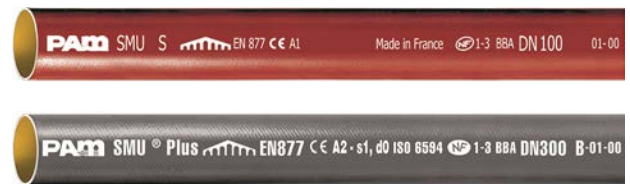
Fig. 1 PAM MA avløpssystem – STANDARD og PLUS rør

Systemene kan også benyttes til bortledning av innvendig overvann, men slike installasjoner er ikke beskrevet i denne godkjenningen.