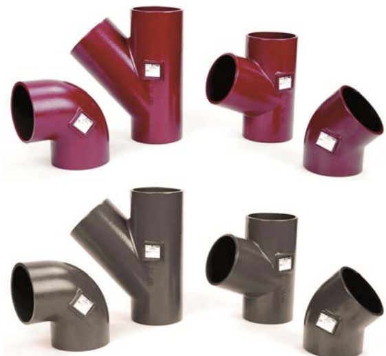
Fig. 2 PAM MA avløpssystem – STANDARD og PLUS rørdeler