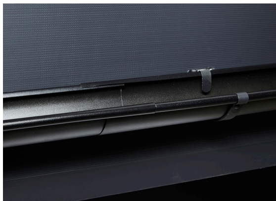
1. Takrenner legges med 80 mm omlegg, uten lim eller skruer.