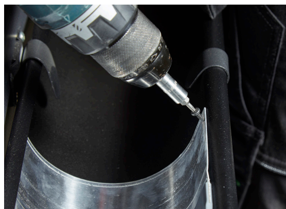
5. Ekspansjonsstykke skrues så høyt opp som mulig i forkant av takrennen.