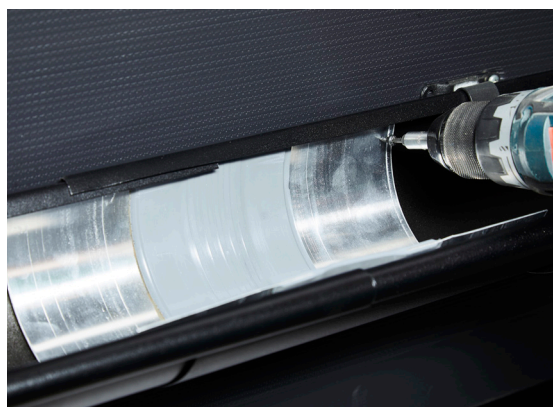
4. Ekspansjonsstykke legges i og skrues så høyt som mulig i bakkant på begge sider. Monteres hver 12. løpemeter.