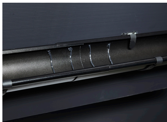
3. To striper Metallim på hver side av skjøten.