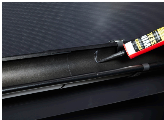
2. Det påføres Metalim NOBB nr. 49617260.