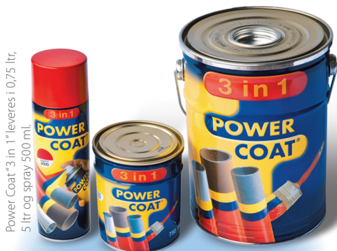
Power Coat "3 in 1" leveres i 0,75 liter, 5 liter og spray 500 ml