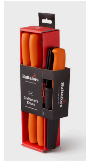
Den klassiske HVK-håndverkskniven – i en ny og praktisk 5-pakning med ett hylster.

Den klassiske HVK-håndverkskniven – nå tilgjengelig i en ny og praktisk 5-pakning med ett hylster. Kniven er uendret og fortsatt utviklet for oppgaver som krever en skarp og sterk allroundkniv. Det 2,5 mm tykke bladet i japansk karbonstål er herdet til 58–60 HRC, og eggen er slipt i flere operasjoner med avsluttende bryning på lærskive for optimal skarphet.