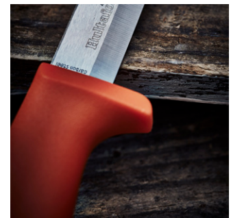
Skaft og slire er produsert i slagfast PP-plast som tåler krevende bruk.