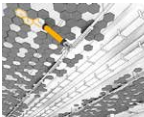
Liming av tak for lydemping