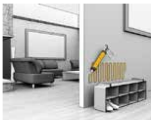
Liming av skap på veggen