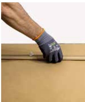
Fester raskt ved påføring