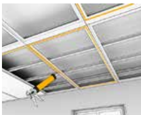
Liming av plater til trerammer