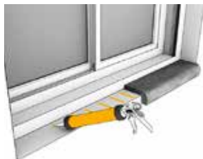
Liming av vinduskarmer innvendig