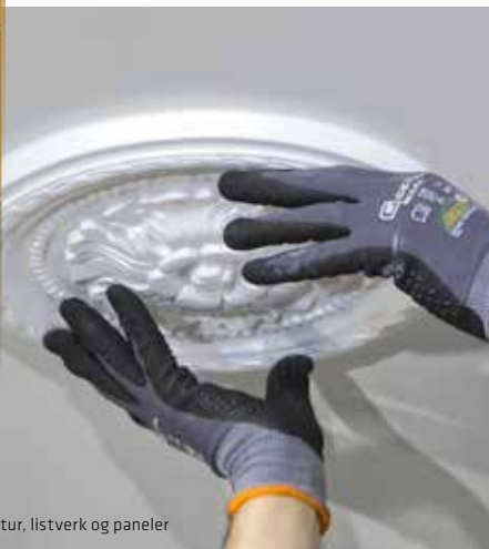
Perfekt til stukkatur, listverk og paneler