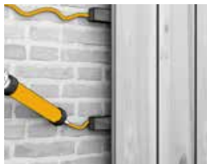
Liming av trebjelker