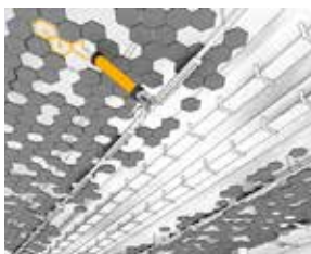
Liming av tak for lyddemping