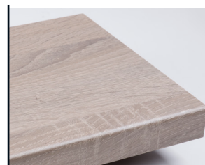
3156 SC Sawcut Eik