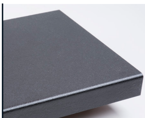
1049 Q Svart Trento

Laminert topplokk til sisterne (sisternekeasse) er tilgjengelig i tre ulike dekor. Med dette lokket blir det enkelt å kle sisternen (sisternekeassen) i kombinasjon med Fibo-panel. En av fordelene med eget topplokk er at man lett kan åpne for å inspisere WC-fiksturen.