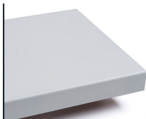
810 P Risør