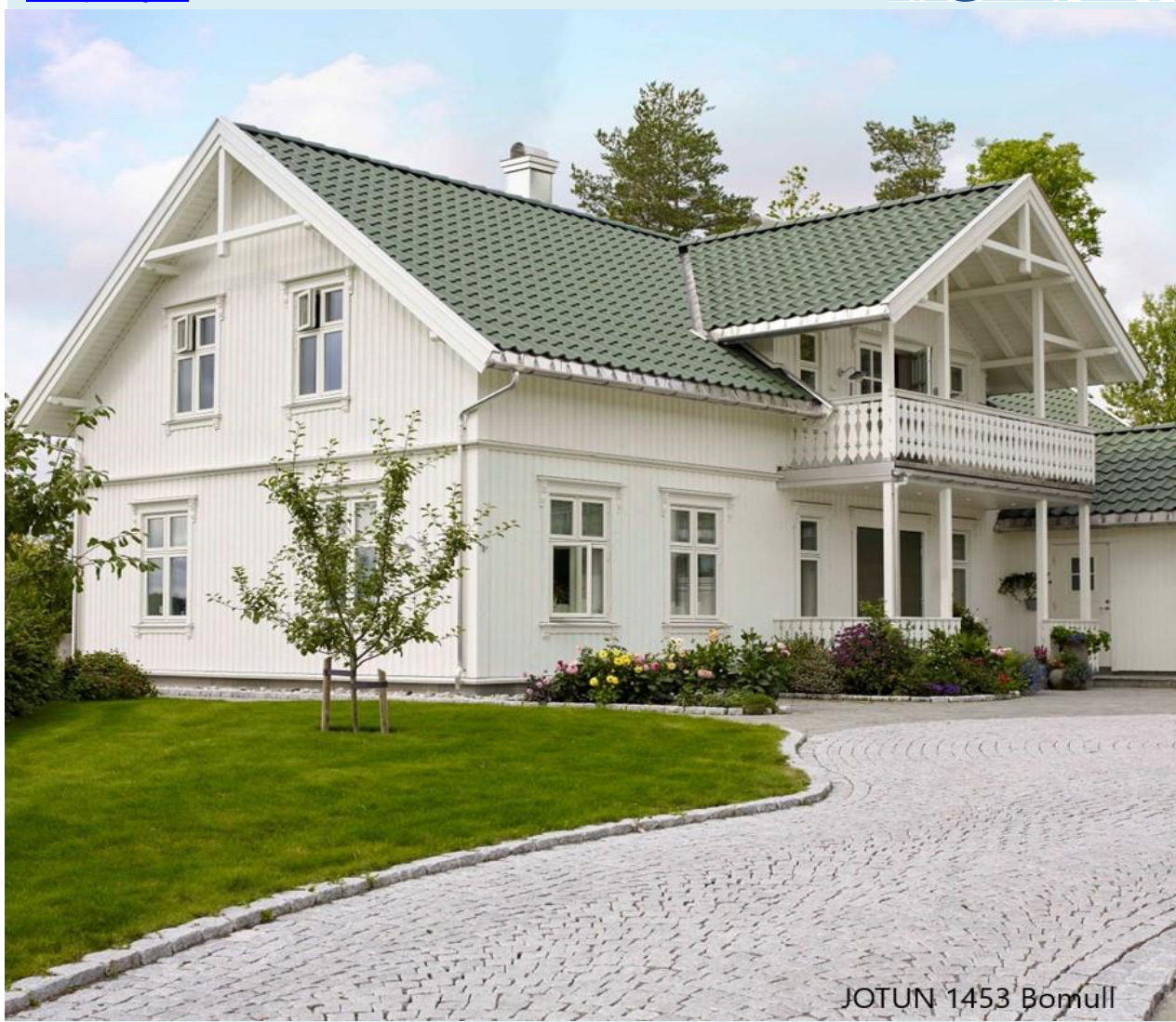
JOTUN 1453 Bomull