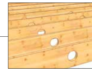
Hulltaking for ventilasjon