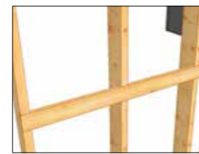
Utfreste hakk for spikerslag

DEN ØKONOMISKE GEVINSTEN LIGGER I DETALJENE