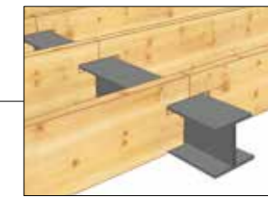
Utfrest for ståldrager