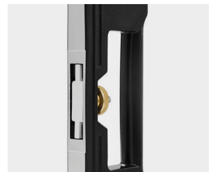
Modulært system – tre faste profil-lengder og forlengelsessats gir rekkevidde opptil 3100 mm