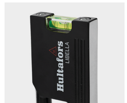
To slagfaste blokklibeller – tydelige avlesninger med selvlysende reflektorer for horisontal og vertikal måling