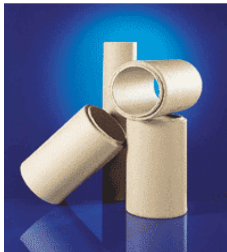
Fig. 1 Runde chamotterør fra Schiedel.

For innfyrt effekt høyere enn 120 kW må dimensjonsvalget dokumenteres separat. Skorsteiner godkjent for oppstilling direkte mot brennbar vegg, i eller før 1985, må vurderes spesielt i forhold til behov for luftkjøling.